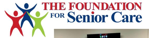
Clases de aprendizaje de computación para adultos mayores y Fix-It-Fridays