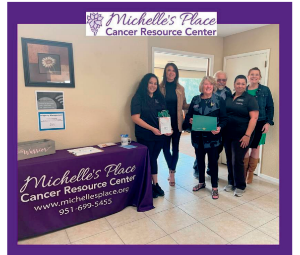
Michelle's Place Cancer Resource Center abre oficina satélite