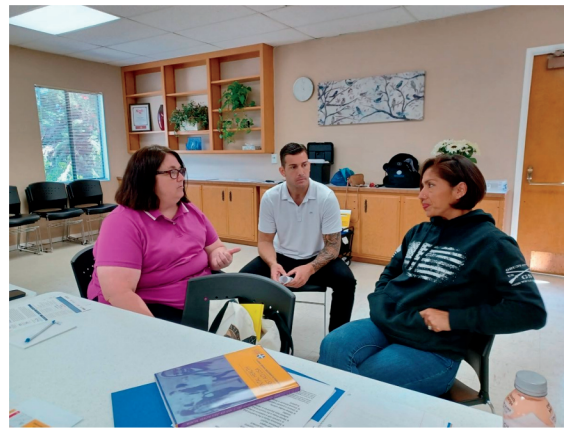
Clases de primeros auxilios de salud mental