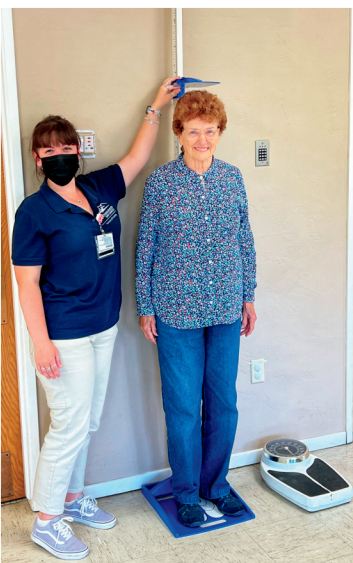
Exámenes y talleres de Miércoles de Bienestar