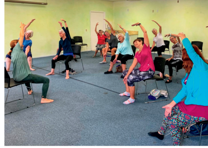
Yoga en Silla