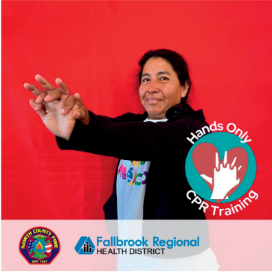
Clases de RCP solo con las manos